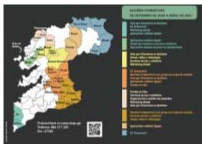
Programa TIC Emprendes