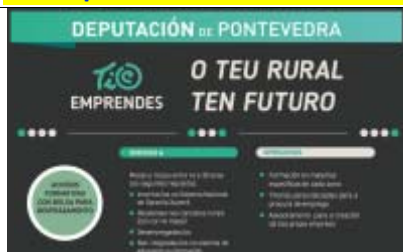
Programa TIC Emprendes